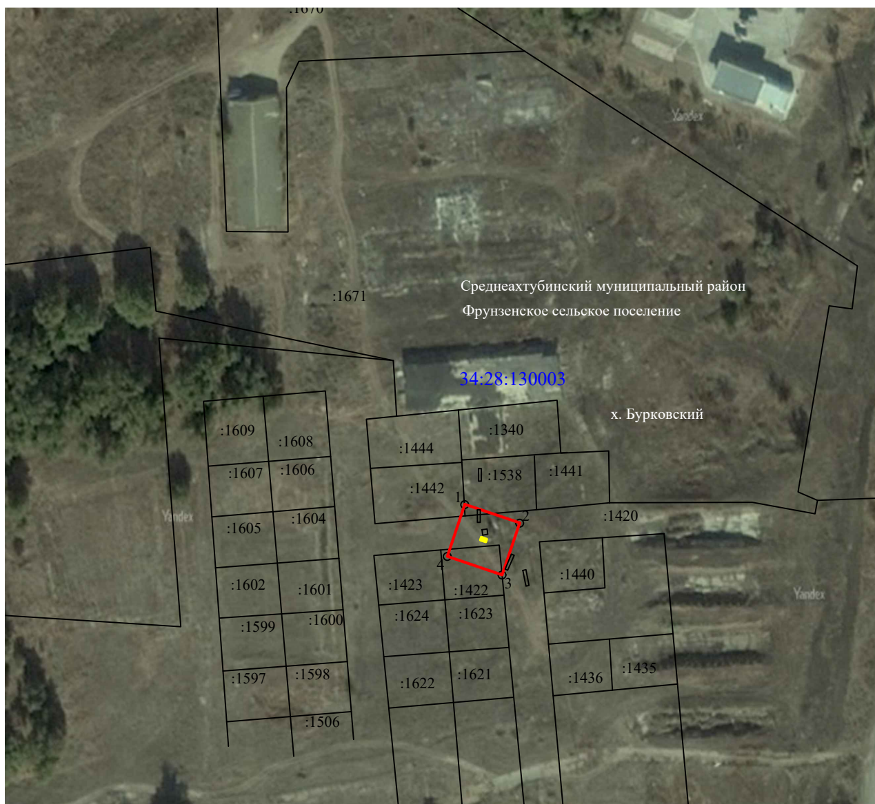
Схема расположения границ публичного сервитута для размещения объекта "ТП № 421", расположенного по адресу: Волгоградская область, Среднеахтубинский район